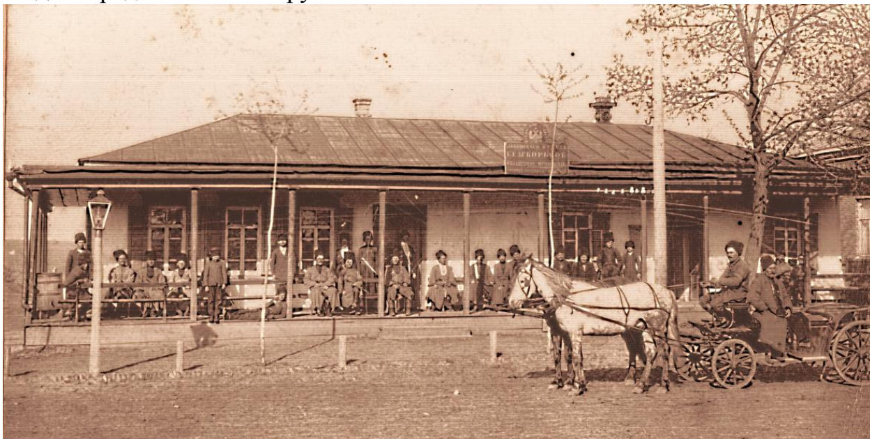
Правление ст. Бесскорбной. Примерно 1910 год. Здание сохранилось.