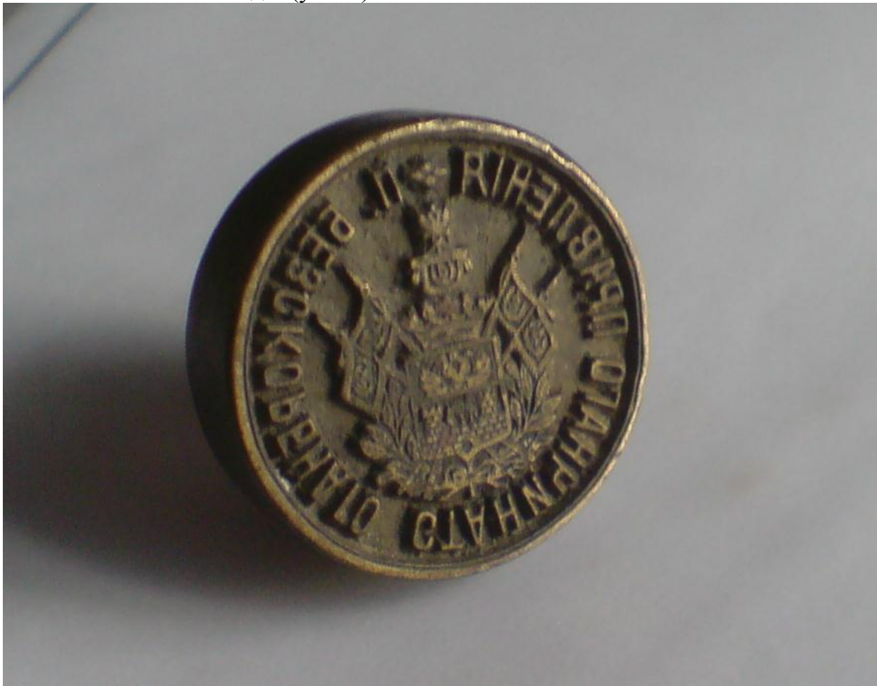
Печать Бесскорбненского правления- сургучовая.

355 четвертей ярового зерна, одна четверть тогда была- 209,66 л. В общественной кассе было всего 10 рублей! Не малое подспорье в хозяйстве давало жителям скотоводство, которое благодаря обилию сенокосов и толоки привилось и стало развиваться. В частном пользовании имелось 517 лошадей, 1500 волов, 1800 коров, 10200 овец и коз. Было 14 пасек, которые насчитывали 700 колодок(ульев).